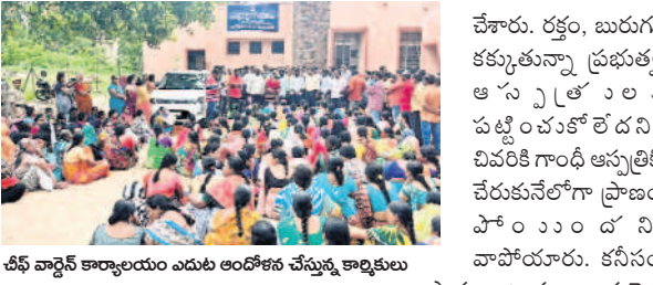
చీఫ్ వార్డెన్ కార్యాలయం ఎదుట ఆందోళన చేస్తున్న కార్మికులు